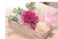
フラワーアレンジメント (選花となります)