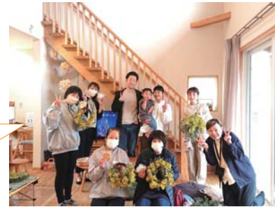
作品と一緒に はい！ポーズ ご参加ありがとうございました

「以前から気になっていたお宅にお邪魔出来てとても勉強になりました！」 ・「スワッグも作る事が出来てとても楽しめました」 ・「色々教えて頂き楽しく作る事が出来ました！」 ・「素敵な家で素敵な方達と楽しい時間がすごせました♪」