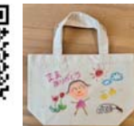
オリジナルエコバッグ