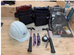
道具袋のプレゼント