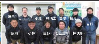
本社工場スタッフ