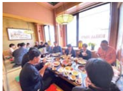
入社式当日の17名による焼肉ランチ