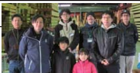
2組のH.O様にご参加頂きました。

毎月第3日曜日、工場見学会と同時に開催される「木工教室」は、お客様だけのご自宅に合った家具作りイベントです。板選りから始まり、デザイン・製作まで楽しむことができます。ホームオーナー様にご参加いただいている弊社ならではの大好評のイベントです。