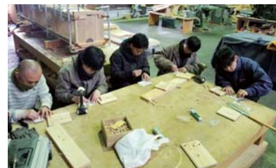
ダボ埋め作業中 みんな真剣です