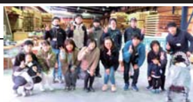
2組のH.O様と1組の子ども園様にご参加頂きました。

毎月第3日曜日、工場見学会と同時に開催される「木工教室」は、お客様だけのご自宅に合った家具作りイベントです。板選びから始まり、デザイン・製作まで楽しむことができます。ホームオーナー様にご参加いただいている弊社ならではの大好評のイベントです。