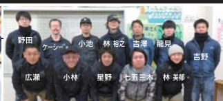
本社工場スタッフ