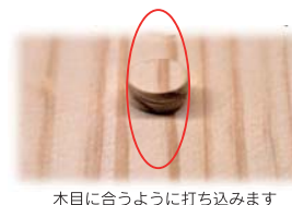
木目に合うように打ち込みます