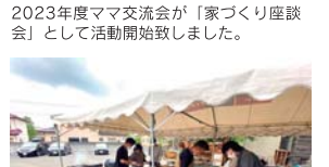
パパもお子様と外で BBQ を楽しめるイベントになりました。