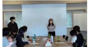
2023年度ママ交流会が「家づくり座談会」として活動開始致しました。