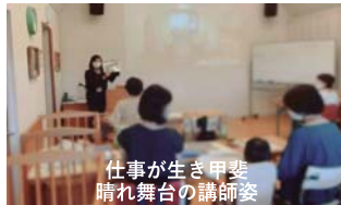
仕事が生き甲斐 晴れ舞台の講師姿