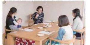
2015年当時のママ交流会少人数精鋭ながら内容の充実した一時。

家づくりの経験者(ホームオーナー様)の奥様を講師に招き、ママさん限定家づくり座談会を2015年2月に開催して早8年が経ちました。但し条件としてスタッフは交流会の場に参加できないので気軽に情報交換してください(^^)というフレーズも良かったのか、勉強熱心な家づくり新人奥様がこのイベントに参加されていました。その後、講師のお宅拝見ツアーを企画したところお話が面白かったのか、ほぼ全員参加でした。現在では、パパ同士で、スタッフを交えてBBQの準備をしながら疑問を解決！ママはママ同士で、既にお家を建てた方とこれから建てる方との座談会！スタッフはいないので気軽に情報交換してください(^^)という事でパパは 今でも既に座談会には参加出来ないルールですがBBQという改たな試みも今年から行っております。