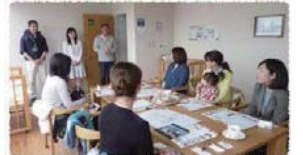
回を重ねるごとにママ交流会の参加人数も増えていきました。