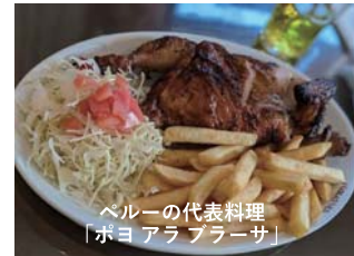
ベルーの代表料理 「ポヨアラ プラーサ」

Q20. 癖はなに？ A: 手の消毒。Q21. どこにでも行けるならどこを旅したい？ A: できるならもう一度ベルーへ。Q22. 無人島へ持ち物は3つまで。何をっていく？ A: ナイフと火起こしと家族写真。Q23. 一番影響を受けた本は？ A: 本は…読みません(+;+。Q24. 小さい時の夢は？ A: 建築家。Q25. 得意な教科は？ A: 数学。Q26. 人生最大の失敗は？ A: なし！ Q27. 一番の成功体験は？ A: 日本語を覚えたこと。Q28. 新しいスキルを身に付けられるとしたら何を選ぶ？ A: お料理。Q29. アメ派？グミ派？ A: ガム派！ Q30. 『タイムトラベル』過去と未来、行くならどっち？ A: 過去。Q31. 何をしている時が一番幸せ？ A: 人とのコミュニケーション。