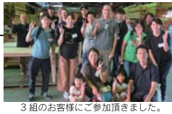
3組のお客様にご参加頂きました。

毎月第3日曜日、工場見学会と同時に開催される「木工教室」は、お客様だけのご自宅に合った家具作りです。板選びから始まり、デザイン・製作まで楽しむことができます。ホームオーナー様にご参加いただいている弊社ならではの大好評のイベントです。