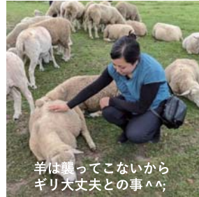
羊は襲ってこないから ギリ大丈夫との事^^;

Q1. 生年月日は？ A: 1995年2月2日の28才です。Q2. 血液型は？ A: A型です。Q3. 星座は？ A: みずがめ座。Q4. 干支は？ A: 亥年生まれ。Q5. 出身は？ A: ベルーです。Q6. 兄弟は？ A: 姉と私の二人姉妹です。Q7. 趣味は？ A: ショッピング。Q8. 特技は？ A: 話を聞く事。Q9. チャームポイントは何？ A: 明るさです！ Q10. あなたにとって女性らしきとは？ A: しくさかな？ Q11. 自分を動物に例えるなら何？ A: うさぎ。Q12. 好きな色は？ A: 赤。Q13. 好きな飲み物は？ A: オレンジジュース。Q14. 好きなフルーツは？ A: オレンジ！ Q15. 5年後はどうなっている？ A: もっとバリバリ活躍しています！ Q16. あなたにとって家族とは？ A: かけがいのない存在です。Q17. あなたにとって仕事とは？ A: 生きがいです！ Q18. イヌ派？ネコ派？ A: 両方苦手です！ ※怖いらしいです。Q19. 永遠に生きられるなら何をして過ごす？ A: 仕事！