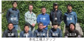
本社工場スタッフ