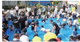
ますのつかみ取り