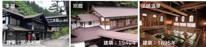
本館 建築：明治初期

法師温泉は、群馬県に7か所ある秘湯のうちの1か所です。本管・別館・法師之湯が明治の遺構として「国土の歴史的景観に寄付しているもの」として2006年に「国登録有形文化財」となっています。