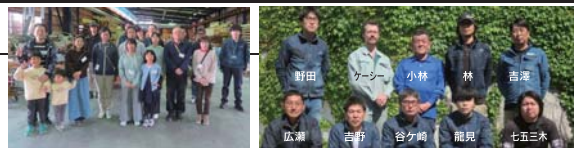
2組のお客様にご参加頂きました。 4月の木工教室

毎月第3日曜日、工場見学会と同時に開催される「木工教室」は、お客様だけの自宅に合った家具作りです。板遊びから始まり、デザイン・製作まで楽しむことができます。ホームオーナー様にご参加いただいている弊社ならではの好評のイベントです。