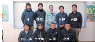
本社工場スタッフ