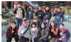
2組のお客様にご参加頂きました。

毎月第3日曜日、工場見学会と同時に開催される「木工教室」は、お客様だけの自宅に合った家具作りです。板選びから始まり、デザイン・製作まで楽しむことができます。ホームオーナー様にご参加いただいている弊社ならではの大好評のイベントです。