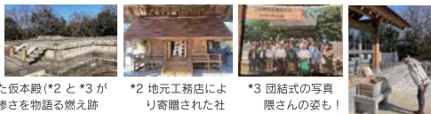
*1 火事に耐えた旧社殿の柱を使った仮本殿(*2と*3が中に飾られます)と火事の凄惨さを物語る燃え跡

この高山神社は「高山彦九郎」という、吉田松陰をはじめとした幕末の志士と呼ばれる人々に多くの影響を与えた人物を祀った神社ですが、2014年に放火被害にあってしまうという悲しい過去を持つ神社でもあります。何も無い場所で手を合わせる参拝者の方々のために、火事に耐えた旧社殿の柱を使って作られた仮本殿の設置*1や地元工務店さんからの社の贈呈*2、団結式や隈研吾さんへの設計依頼*3など、着々と本殿の再建へ動き出した。「未来の名建築」です。私もしっかり参拝して参りました!▼現在は再建へ向け、皆様からの寄付も受け付けております!