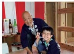
H様 お父様とお子様