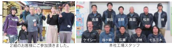
2組のお客様にご参加頂きました。 10月の木工教室

毎月第3日曜日、工場見学会と同時に開催される「木工教室」は、お客様だけのご自宅に合った家具作りです。板選びから始まり、デザイン・製作まで楽しむことができます。ホームオーナー様にご参加いただいている弊社ならではの大好評のイベントです。