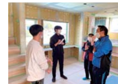
S様 インタビュー写真

スタッフ: 完成見学会では是非皆さんにも見ていただきたいですね！ S様お話しいただきありがとうございました！