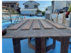
羽目板という加工された木材を使用します。