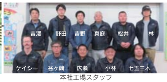
本社工場スタッフ