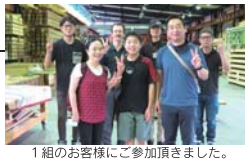
1組のお客様にご参加頂きました。 9月の木工教室

毎月第3日曜日、工場見学会と同時に開催される「木工教室」 は、お客様だけのご自宅に合った家具作りです。板選びから 始まり、デザイン・製作まで楽しむことができます。 ホームオーナー様にご参加いただいている弊社ならではの 大好評のイベントです。