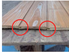
こんな感じに組み合わせます。差し込み組み合わせすることで強度が増します！