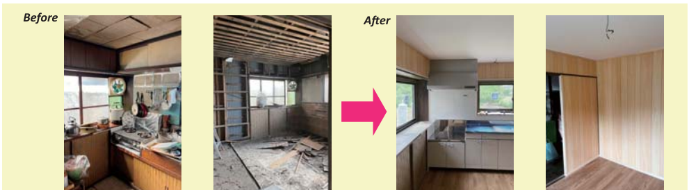
内装は主にキッチン部分をリフォームしました。壁は既存の壁を壊して断熱材を充填しました。