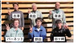
家具工房スタッフ