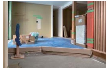
土間は玄関の一部でもあり居間の一部でもあるので玄関も居間もとても広々感じます。そして木の格子により奥のキッチンが見えない所もさすがです。 (設計：土屋)

やあ、よく来たいね！ 寮(さみ)いから、まあ、なか入(へ)って火い、 あたってがっしゃい！