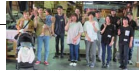
2組のお客様にご参加頂きました。

毎月第3日曜日に開催される「木工教室」は、お客様だけのご自宅に合った家具作りです。板選びから始まり、デザイン・製作まで楽しむことができます。ホームオーナー様にご参加いただいている弊社ならではの大好評のイベントです。