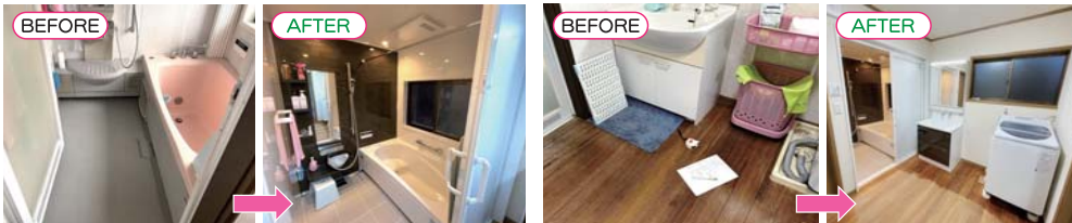
お風呂：入れ替え工事