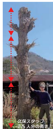
久保スタッフ 2.5人分の高さ！