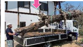
倒れた木をクレーンで乗せて作業終了です。