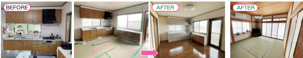
キッチン：入れ替え工事