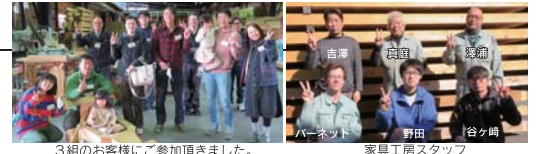
3組のお客様にご参加頂きました。

毎月第3日曜日に開催される「木工教室」は、お客様だけのご自宅に合った家具作りです。板選びから始まり、デザイン・製作まで楽しむことができます。ホームオーナー様にご参加いただいている弊社ならではの大好評のイベントです。