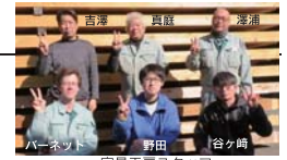
家具工房スタッフ