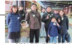
2組のお客様にご参加頂きました。

毎月第3日曜日に開催される「木工教室」は、お客様だけのご自宅 に合った家具作りです。板選びから始まり、デザイン・製作まで楽 しむことができます。ホームオーナー様にご参加いただいている弊 社ならではの大好評のイベントです。