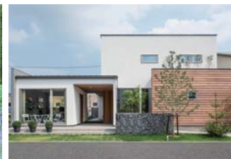
代表的なお庭の写真