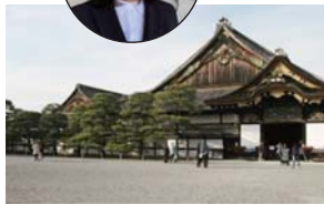
旅先で建物の写真を撮るのが好きです (京都の二条城にて)

学生時代には自分の仕事として建築にかかわったことはありませんが、これからは責任や学生時代には味わえなかった楽しさも出てくると思います。日々勉強しながら、責任をもってお客様の素敵な生活の一部に関わっていきよう頑張ります！ 現場監督をがんばりたいというチャレンジ精神は、きっと職人さんたちも応援してくれる事と思います。ぜひ頑張ってください(^^)/