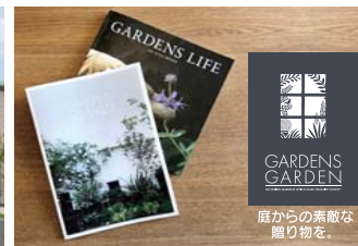
ガーデンスガーデンの冊子とロゴ