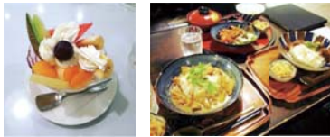
レトロな食器が好きで、古い喫茶店でアルバイトをしていました(^^)