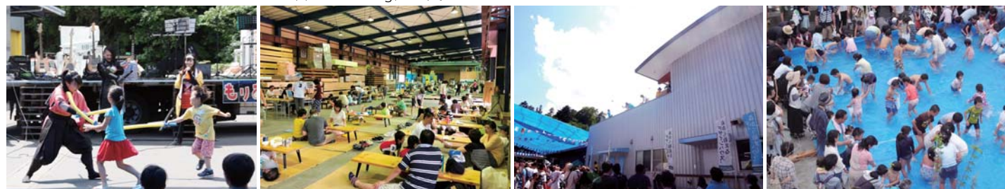
この子どもたちは手ごわいぞ!!