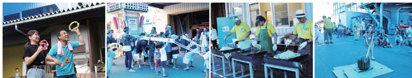
さあ～一緒に踊るぞ!!