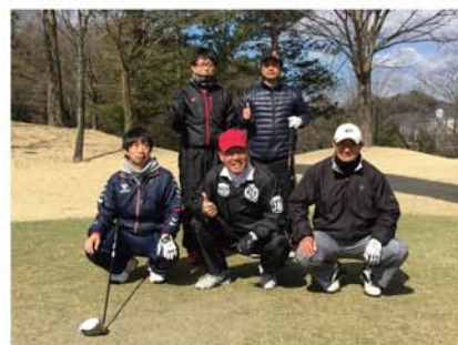
ゴルフクラブのメンバーと。