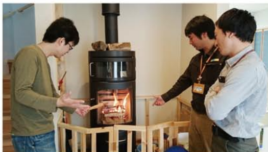
牛乳パックを火種に！！