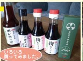
いろいろ買ってみました。

豆と麦と水と塩で仕込まれ、酵母菌で発酵熟成され1年半かか醤油になります。このような伝統的製法の醤油蔵は県内でも3ヶ所だけのことです。蔵の命の酵母菌がいたるところにびっしり付いていました。