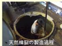
天然樟脳の製造過程

昔はタンスに必ず入っていた防虫剤の樟脳。おばあちゃんの臭いと連想する人も多いのでは？