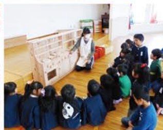
沼田市 白沢保育園様