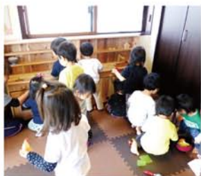
みどり市 保育ルームとりのはね様