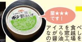
★★★★です! アイスを食べながら窓越しに見ていたら……

お店は国の有形重要文化財と大変貴重なものです。築150年の中に有るお座敷の喫茶スペースで醤油ソフトとボン酢アイスを食べました。