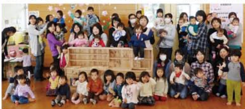
伊勢崎市 赤堀児童館様