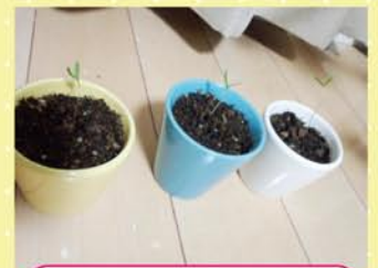
夕ネから育て発芽しました♪