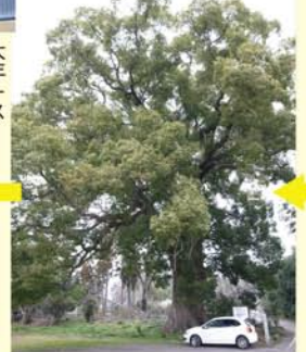
今度こそ、本来の目的地桐生市新里町「野のオオクス」へ到着! 樹齢700年の圧倒的存在感のクスノキです。