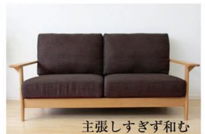
主張しすぎず和む