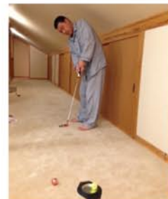
得意なカーペットバット