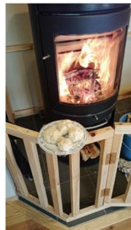
ピザ生地を発酵させてます