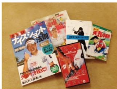
教科書はたくさんあります。