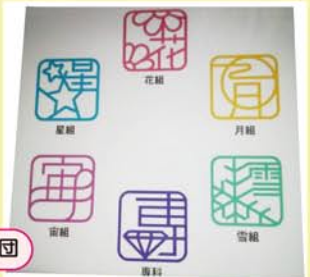
大～好きな宝塚歌劇団

高橋：宝塚劇場の生オーケストラに踊りながらの生歌って迫力満点なんでしょうね～(x^ω^x)