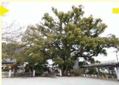
入口脇のお堀のすぐ近くに樹齢650年といわれるクスノキは有ります。