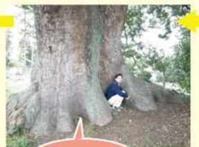
幹だってこの太さ! 大きなクスノキのしたでえ!