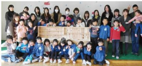
甘楽郡 新屋保育園様