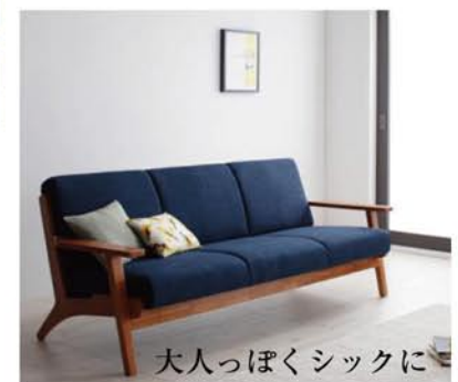
大人っぽくシックに

ソファなどの家具の色や照明の色みで違った雰囲気演出することができます。 どのような生活を送りたいかによって家具を選んでみるのはいかがでしょうか？ リビングにスタンド照明なんかを置いてみるのもいいですね！