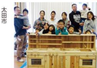
太田市 藪塚本町南幼稚園様