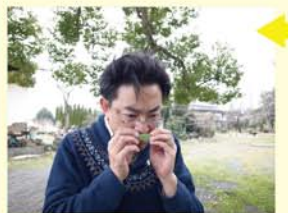
葉っぱを嗅いでみました。独特の香りがしたことを最後に報告させていただきます。

帽子をかぶりいかに食品工場の見学っばいです。こちらの大きな杉樽は、なんと100年以上も使っているそうです。