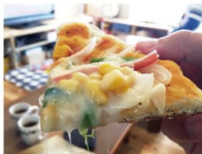
焼きたてのピザをごちそうになりました！