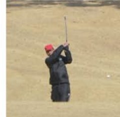
一見シングルプレイヤー