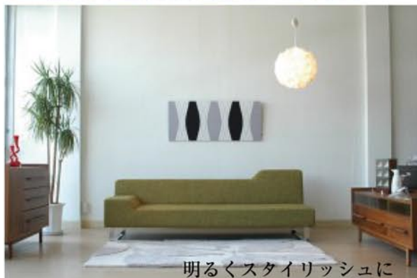
明るくスタイリッシュに