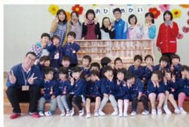
太田市 藪塚本町南幼稚園様