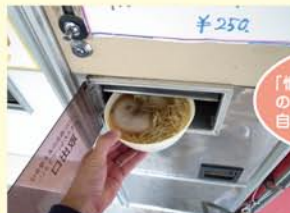
「懐かしい〜」昭和のかほりブンブンの自販機レストラン。

続きまして2本目のクスノキへ出発! 桐生に行くはずがなぜかみどり市東町へ来てしまいました。国道122号線沿いの「丸美屋」さんへ到着! 少し前にテレビで取り上げられていて無性に行ってみたくなったのです。