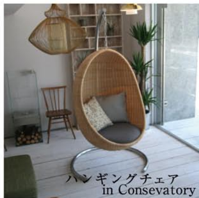
ハンギングチェア in Conservatory