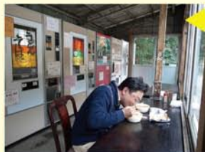
なんと昼食はここで済ませることに。(怒らないカミさんはエライ!) 味が良いと評判のうどんとトーストサンド、ラーメン。しめて¥800也。