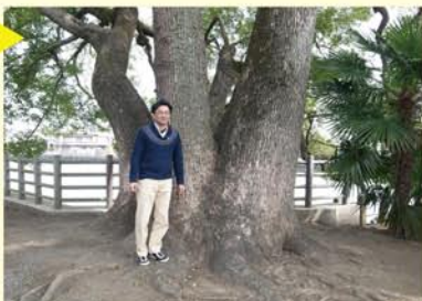
なるほど枝分かれの多い樹形ですね。