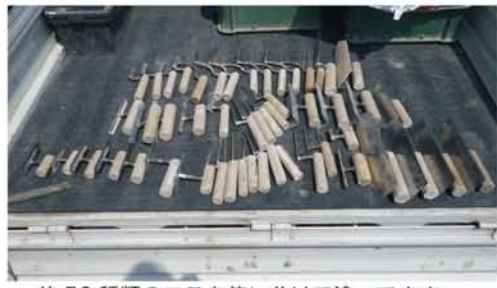
約50種類のコテを使い分けて塗ってます。