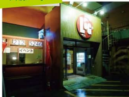
森の音楽隊が練習中の、県内某スタジオにさっそく潜入。

ふれあいサークルでは、社員とホームオーナー様や、協力業者さんとで、一緒に様々な活動を行っております。今回から、各部の活動に私自ら潜入し、体験して、ご紹介していきます。まず初めは、7月に行われた感謝祭で、演奏を披露して頂いた「森の音楽隊」に密着取材です。