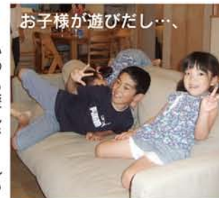
お子様が遊びだし…