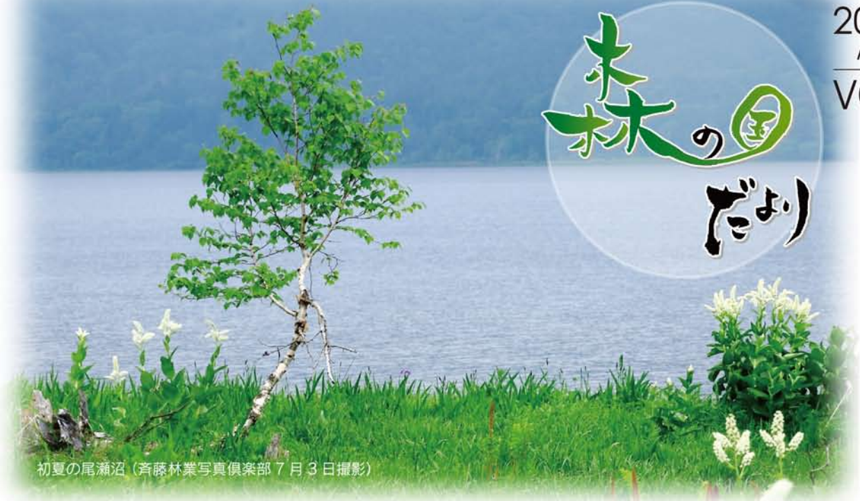
初夏の尾瀬沼（斉藤林業写真倶楽部 7月3日撮影）