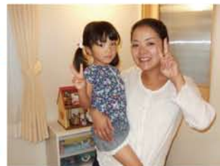
泣きやんでピース☆