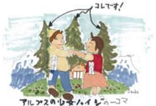
ハイジの山小屋の裏の大きな3本の樹もモミです。

特徴も、シックハウスの原因物質ホルムアルデヒドの除去率はスギに次いで優れ、他にも抗菌、消臭、調湿、抗酸化作用が高いとされ、たしかに体に良さそうです。その反面、モミの木自体は香りは弱く、見た目も白っぽく木目も穏やかであることが同じような効用を持つスギ、ヒノキ、ヒバとはちがう面と言えます。