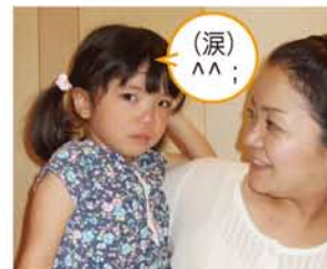
お兄ちゃんがたいたい~