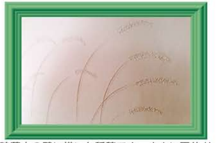
珪藻土の壁に描いた稲穂です。まさに画伯!!