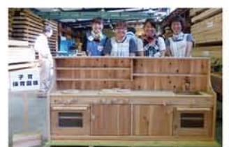
ままごとキッチン 昭和村 子育て保育園様