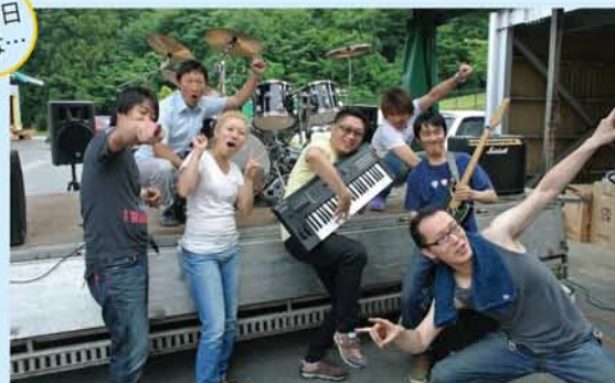
感謝祭のリハーサル後の仲よしメンバー

斉藤林業では、写真倶楽部・アウトドア倶楽部・ゴルフクラブ・フットサルクラブ・ツーリングクラブ・DIYくらぶ・SRTC（硬式テニス）・indoorclub（室内運動）・森の音楽隊 が、活動しております。参加自由ですので、ご興味のある方は、前橋デザインセンター斉藤まで♪