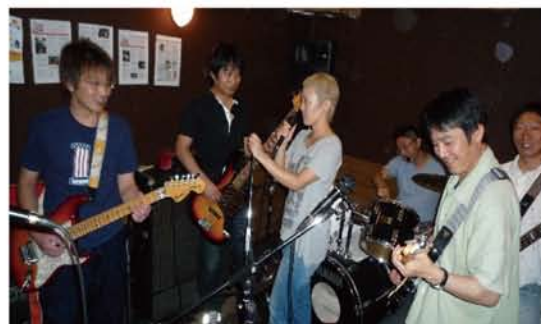
スタジオ内では、夏の感謝祭のステージに向けて、練習の真っ最中でした。