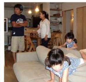
座る場所がなくなるパパ^^。 P7