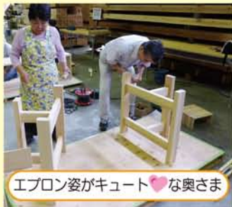
エプロン姿がキュート♡な奥さま