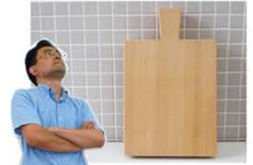
まな板にも良さそうです。カワイイ形のまな板をつくれれば売れるかなあ？

なので、保存したいけど臭い移りは嫌だ=食品の保存や衣類の収納にはぴったりと言えます。より生活に密接したシーンで使ってもらいたいですね。 さて、当社のモミ(くんえん乾燥後かれこれ7年ほど寝かせてある熟成材とのこと)はどのような形となって皆様の暮らしに活かされるのでしょうか？