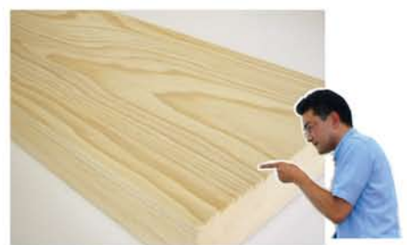
色や木目は穏やか。 なので塗装にもバッチグーです。