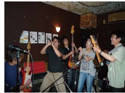
突然の取材にも温かく迎えていただき、楽器のできない私は、シャウトで参加してきました。