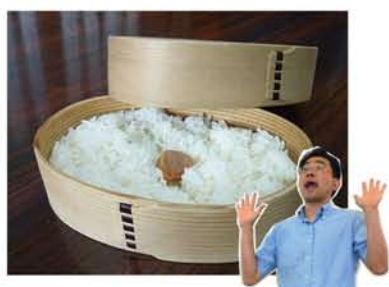
毎日チンしても10年以上もつとか