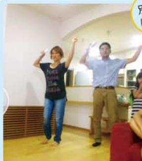
ホームオーナー様宅でダンスの練習中