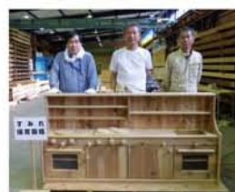
ままごとキッチン 桐生市 すみれ保育園様