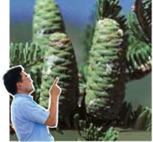
モミの種子(モミぼっくり?)は、マツのように厚で落下でなく、一枚一枚抜けて風に乗って飛んでゆくらしい。