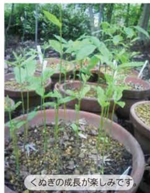
くぬぎの成長が楽しみです。