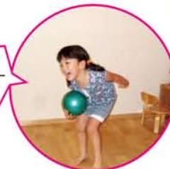
私もサッカーやるう~。