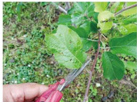
病気になった葉はハサミで一枚づつカットします。