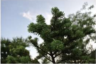
こんな葉っぱです。(支店の庭にて)

モミの木は学名をアビエスというラテン語、意味は「永遠の命」です。日本語でのモミ(樅)の語源は風に揉まれるさまだったり、神聖な木として信仰の対象としての「臣(おみ)の木」、実がもろく散ることから「もろい実の木」が縮まってなど諸説あります。世界には樹齢1000年以上のもが多くあって、高さは60m以上まで成長します。モミの木の使われ方で有名なクリスマスツリーは、病気退治のため家の中に入れたのが始まりと言われてます。まさに学名「永遠の命」を願っての習わしですね。