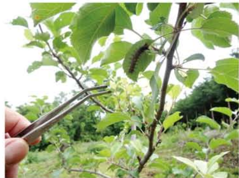
毛虫は一匹一匹ピンセットで駆除。