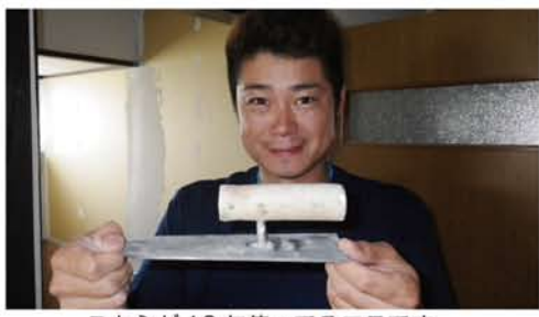
こちらが18年使ってるコテです。