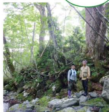
お気に入りのとちの木（樹齢推定 300年）