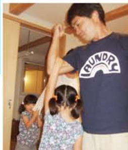
いつも遊んでくれる 大好きなパパ♪