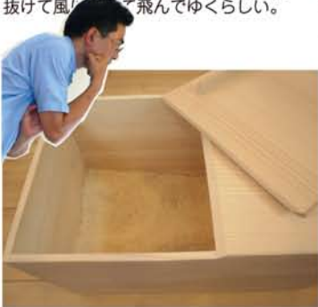
米櫃(こめびつ) 御飯を炊くための米を入れる容器