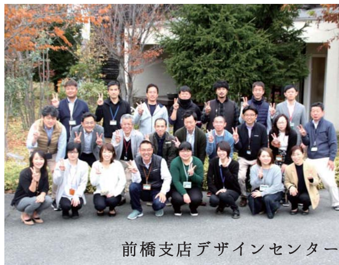
前橋支店デザインセンター