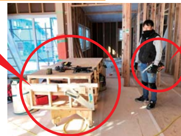
▲普段作業をしている場所

釘やビスといった小物やコード類、電動工具がきれいに納められています! それぞれ決められた場所があり、探す手間がなくなるので、仕事の効率化に繋がっています!