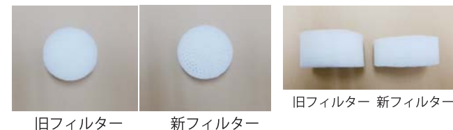
旧フィルター 新フィルター