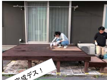
あと少しで完成デス!