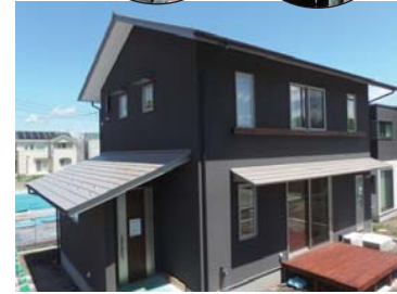
Y様邸 新築当時の写真!