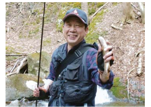
今年の第一号の「イwana」を釣った瞬間!!