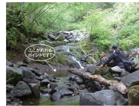
「釣れるのかな…」とワクワクするような瞬間です。