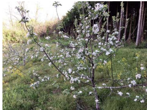
りんごの木の花の満開