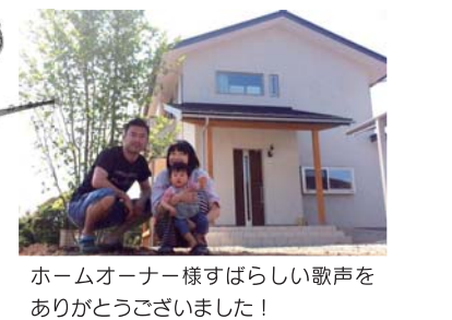
ホームオーナー様すばらしい歌声をありがとうございました!

コトバの選び方もとても素敵で、歌を聞きながら思いを巡らせていました。演奏後とてもほっこりと温かい気持ちに。たくさん苦労したところもありますがお施主様の人生の大きな節目に参加させて頂けることに嬉しさと誇りを感じます。“大きな力”とさせて頂けてほんとにうれしく思います。頂いた歌詞カードとピックは仕事場デスクに置き、日々エネルギーを頂いています(^_^) ♪ お客様係 鈴木真依