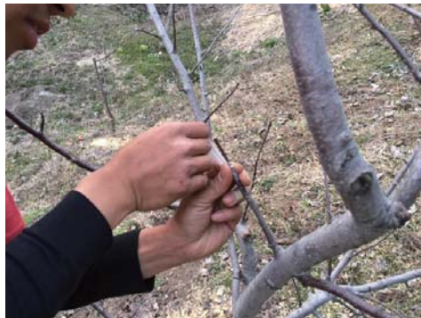
陽佳さんが接ぎ木をしてきている所