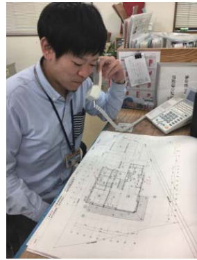
写真ではニヤついています(^_^;)