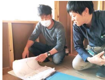
稲数棟梁と打合せ!