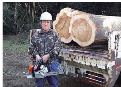
こんなに太くて育ってくれたんだね。大黒柱とダイニングテーブルに生まれ変わるのが楽しみです。