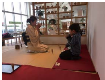
お茶の召し上がり方のワンシーン。茶器の持ち方、お作法を教わりながら頂きます。「おいしい！おかわり！」って(笑)