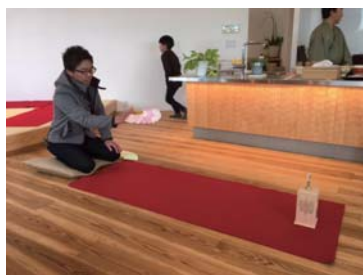
芸者さん遊びの『投扇興』も体験☆扇子を飛ばして、置物を倒す遊びです。これがなかなか難しい！！倒れると「やったー！！」って歓声があがりました。