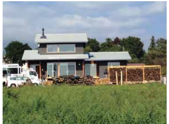
会場となったT様邸は黒い外壁が印象的です！

10月末に行いました「お住まい大見学祭」の様子をリポートします！ このイベントは、実際に住まれるお宅のデザインや間取りのこだわり、暮らしの楽しみ方をご覧いただき、これから家づくりをされる方々の参考にしていただく事ができます。会場となったT様邸では、弊社の家づくりを肌で感じていただく試みとして、内部の仕上げに使われているケイソウ土塗り壁と同じ材料で塗り体験ができるコーナーを設けました！