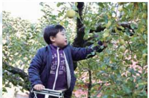
さ～てお待ちかね りんご狩り！この時期のりんごが 一番おいしい！あま～い群馬名月に大喜び！！

国土の約7割を占める「森林」は、私たちに美味しい空気と水を届けてくれるだけでなく ※水源涵養や土砂災害の防止などの機能も果たす美しい場所です。齊藤林業ではこれからも「ままごとキッチン」の寄付を通じて多くのお子様たちに木材の良さを、森の大切さを伝えていきたいと考えております。 ※水源涵養とは水源の確保、洪水の防止、河川の保護などのための保安林