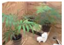
大事に育てている観葉植物！