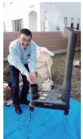
木質ペレットを燃料としたグリルヒーター「きりんさん」