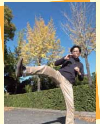
イチヨウの前でアチャウ！