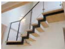
宙に浮かんだ階段！