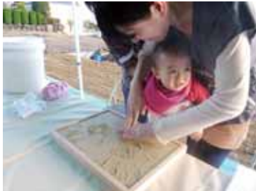
初めての手形押しにお子様は戸惑い気味！？