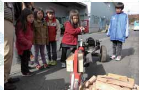
薪割機による薪割体験 やっぱりみんな機械が大好き～ 大きな音で！ガンガン割れて！みんな大興奮！！