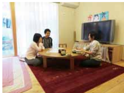
木工教室の力作 丸座卓を囲んで♪