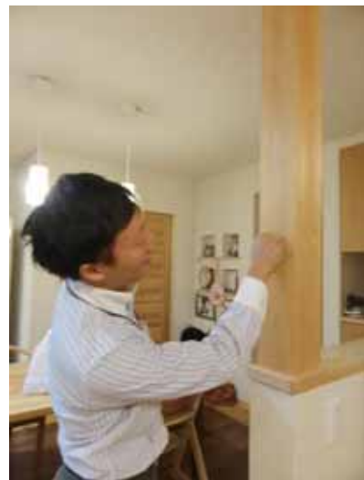
床材に合わせてこちらの化粧柱もヒノキにしたんですよ〜今でも良い匂いがしますね！