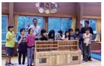
伊勢崎市 赤堀あさひ児童館様