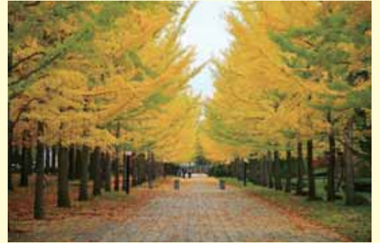
紅葉も美しく、すべて黄色くなる前のこのくらいが個人的には好きです。