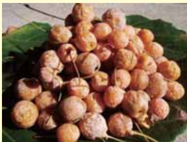
一説には種まで食べてしまうサルやヒトから種を守るためという説もあります。秋に公園を歩く際は気を付けてください。実を付けない雌株だけ植えることもあるそうです。