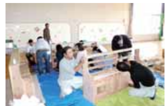
太田市 太田市立生品幼稚園様