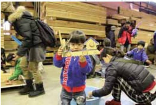
群馬県産材のスギの端材を使用した写真立作り 貼り付けた、木のおもちゃもちろん安全なスギの 端材です。みんな無言で集中！上手に出来るかな？