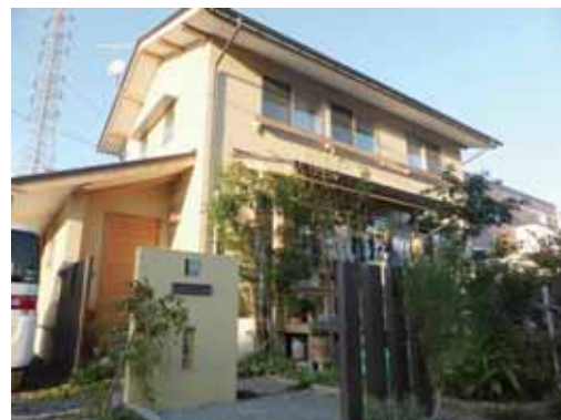
周りにはない和風の外観