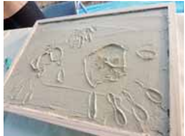
ご家族みんなで記念の手形！