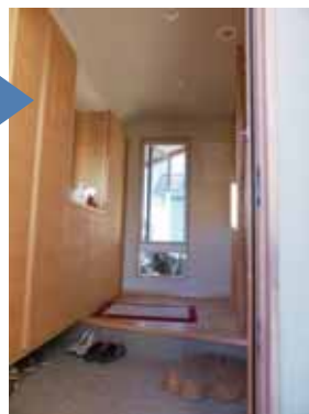
玄関 after 4年でこんなに色艶がよくなりました！