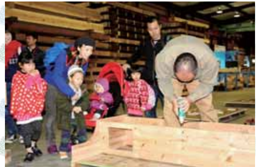
ままごとキッチン作製の見学 「幼稚園にもあるよ～」ここで作っているんだよ～！