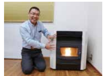
事務所のペレットストーブと一緒に