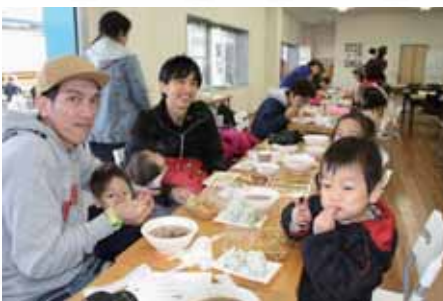
昼食はスタッフで作った、 トン汁と焼きそばにチヂミ！ 寒いから体があったまるね！