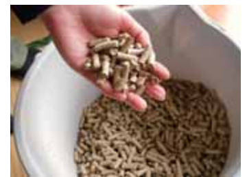
【木質ペレット】直径6~8ミリの円柱状で、木の香りがします。