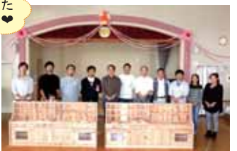
太田市 太田市立生品幼稚園様

●ままごとキッチンは、県内の幼稚園・保育園のご父兄様や先生方に製作して頂き寄贈させて頂いております。目指せ～100施設!!