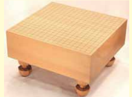
板材は加工性に優れ、歪みが出にくい特質を持ちます。碁盤や将棋盤の適材として、また油分を含み水はけが良いためまな板の材料として最適です。感謝祭の抽選で当たった方、実は高級品なんですよ！