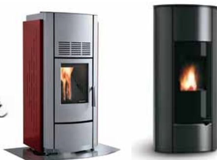
デザイン性の高いペレットストーブの一例