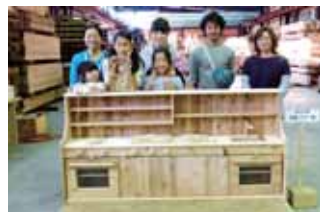
沼田市 おひさま学童クラブ様