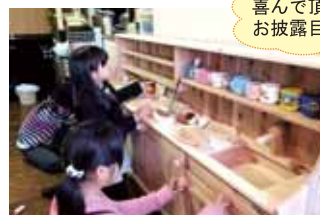
沼田市 おひさま学童クラブ様