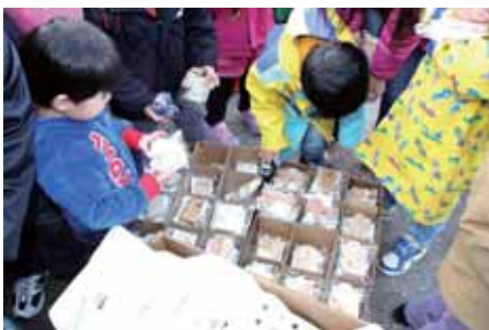
写真立にも使用した、スギの端材で作った 木のおもちゃのプレゼント 「ゾウとリスとイヌと…どれにしようかな～」