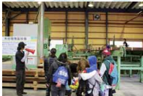
工場見学では、沢山の機械に興味しんしん～ あいさつも大きな声でできました。