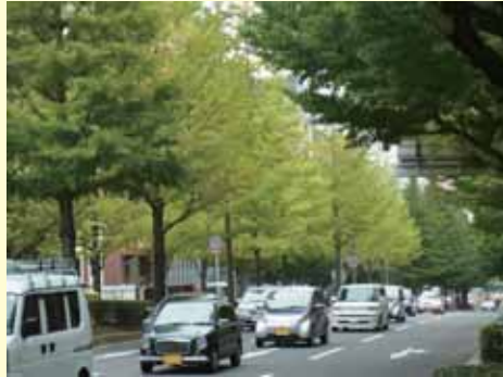
排ガスや剪定に強い街路樹によく使われます。また燃えにくいことから防火性を求められる地域の街路樹には特に多く用いられます。