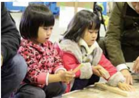
ヒノキの端材を使用した「マイ箸」づくりに挑戦 「私の作ったお箸でご飯を食べる」 ごはんを食べるの楽しみだね！