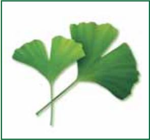
この葉っぱでおなじみの木です。

今回ご紹介する樹木はイチヨウ。街路樹や公園、お寺や神社に植えられているおなじみの木です。名前の語源は宋代時代の中国語「イーチャオ」といわれています。イーチャオとは「アヒルの脚」という意味で葉っぱの形がアヒルの脚の水かきに似ているからだそうです。イチヨウは古代植物に多く見られる裸子植物で太古の姿のまま現代に残していることが化石からも確認されていて「生きた化石」と呼ばれています。恐竜が活躍したジュラ紀に世界中に広まりナウマンゾウがいた氷河期に絶滅したとされましたが、中国南部浙江省天目山に唯一生き残ったイチヨウが人に発見され再び世界に広まったという歴史を持ちます。日本には仏教とともに平安後期から鎌倉初期に中国から伝来したと考えられています。秋に成る実の種子はギンナンです。私も好きな食べ物ですが、何しろ臭いので「やってみたシリーズ」でとりあげるのは勘弁してください。