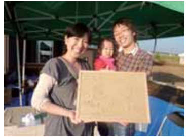
玄関やリビングに飾って下さいね