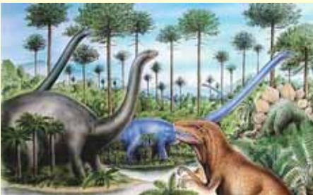
ジュラ紀に草食恐竜がギンナンを餌とし、その排泄物により世界中に種が運ばれ広まったといわれています。