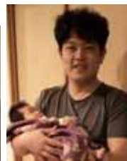
イクメンで頑張ってます♪