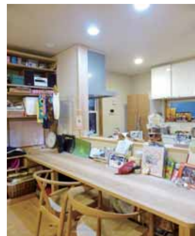
勉強をすることを想定したカウンター上は照明を明るく