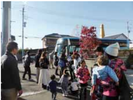
さ～て前橋支店から出発です！ バスで遠くに行くだけでワクワクするね！

弊社で取り組んでおります、「ままごとキッチン」の寄付は現在、46施設・52台！ 県内の幼稚園・保育園・児童館などに設置して頂いております。木材に子供のころからふれあう事で、地元の山や木に興味を持ってもらい豊かな心に育ってもらう事また、捨ててしまう端材を利用し作製する事により最後まで木材を使い切る、物を大事にする思いを養って頂く事を目的としております。 今回の見学会ツアーは、寄付させて頂いた施設の園児・父兄様 140名のご参加です。