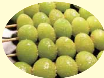
美味しいギンナンですが、食べ過ぎるとお腹をこわすので注意です。