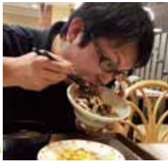
「牛丼をかきこむ ほくくほ」

真白な時は風にさらわれて～♪新しい季節を運ぶ～♪ はい！ほくくぼです 健康診断結果発表！ 昨年暮れから-11 kg・胴回り-11 cm！のダイエットに成功いたしました！リバウンドしないようにこれからもがんばります。 今回のくぼさんぽは、11月に行われました「ままごとキッチン」のふる里を見に行こう」バスで行く工場見学会&りんご狩りツアーのご紹介です！