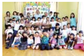
邑楽郡 千代田町児童館様