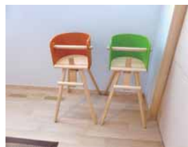
お家にマッチする子供チェア