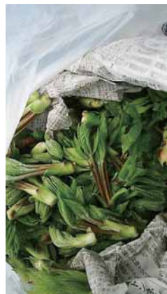
コシアブラいっぱいゲット！ 道の駅行けば結構いい値段で 売られていますよね〜。ウマそ。