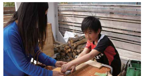
たくさんのご家族が参加してくれたマイ箸づくり。自分つくった箸で食べるご飯はおいしいこと間違いなし!