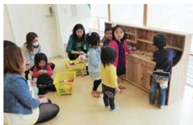
高崎市総合福祉児童センター様 (3月製作)