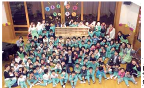
太田市 はずみ幼稚園様 (3月製作)