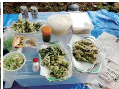
現地でもう！それが俺流とでも言わんばかりに 気分はルンルンピクニック。そばとがあるし。