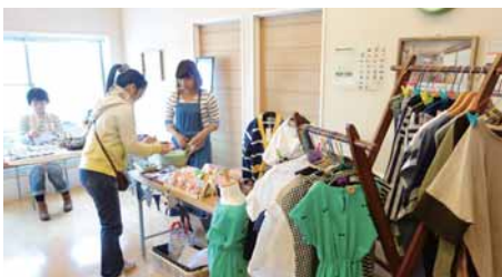
手づくり雑貨も盛りだくさん! 作家さんもお客様との交流が楽しかったと話してくれました♪