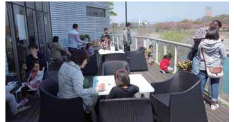
この日はポカポカ陽気で、みなさんテラスでお食事をされました。景色もサイコーです♪