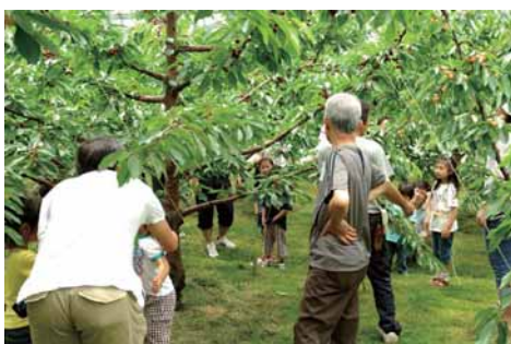
大好評の「さくらんぼ狩り」