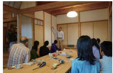
スタートは「我が家のコンセプトから…」