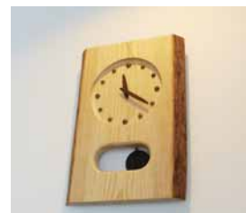
グリトモで買った木の時計