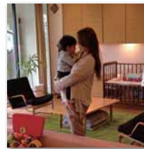
初めて会うお子さんとも 直ぐに仲良しに！（^^）