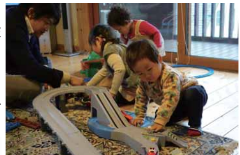
リビングにキッズコーナーを作りました。