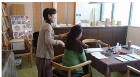
大賑わいの会場内でしたが、ここではゆったりと時間が流れました。個室でくつろぐリラクゼーションコーナー。