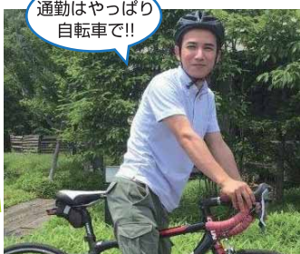
通勤はやっぱり 自転車で!!