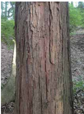
木肌はスギによく似ています