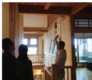
これが夏を涼しくする工夫の一つです。汚れが気になるキッチンの床もこんな感じです。