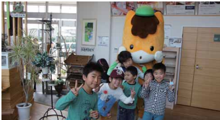
当日は、なんと「ぐんまちゃん」も登場! 大人にも子どもにも大人気でした!

4月13日(日)グリーントゥモローにて第1回「グリトモ市」を開催しました!「家族で遊ぶ楽しいイベント」をテーマに美味しい食べ物や手づくり雑貨、ワークショップやリラクゼーションコーナーなど豊富に揃え、日頃お世話になっている皆様へ感謝の気持ちを込めて開催させていただきました。当日は800名を超えるお客様に会場にいただき、大変賑わった1日となりました! お客様からは「楽しい1日をお過ごししました♪」とうれしいお言葉もいただきました! 本当にありがとうございました! 斉藤林業主催のマイ箸づくりや木のおもちゃの切り抜き体験のワークショップも大好評で、木の温もりに触れ、物を大切に長く使ってほしい気持ちをもつくりを通して伝えることができました。人のつながり、地域とのつながりを大切にたくさんのお店者さんと共に、毎月第2日曜日に開催していきますのでよろしくお願ひします♪