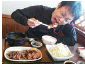
「カツにガツク ほくくぼ」