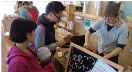
地域でおいしいと評判の食べ物を集めたフードコーナー。開始2時間で完売続出でした!