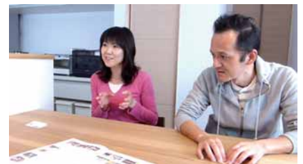
家づくりの楽しい思い出を 語ってくれました。