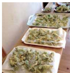
デザインセンターにもお裾分け。 私は社長作のきのこ汁に浸し系で 頂きました。ゴッソマ！

旬を収穫する楽しさ、そしてそれを賞味する と言う美味しさをダブルで体験出来た今 回の企画、何と発起人はオーナー様との事。 斉藤林業社員一同は楽しい事が大好きです。 そして美味しい物が食えれば尚良いです。 クラブ活動に限らず最高に楽しい遊びをご 存知の方、ご参加頂くのは勿論の事、発案 もお待ちしております！