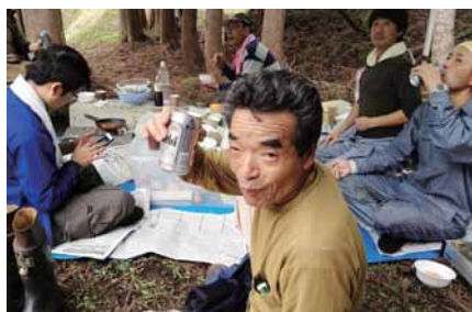
どこでも飲む！それがタモツ流とでも 言わんばかりにいつでもルンルン元棟梁。