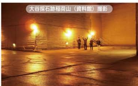
大谷採石跡稲荷山（資料館）撮影