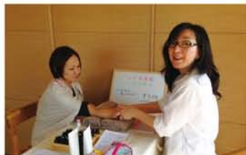
アロママッサージで出店された方もいます。部屋中とても良い香りに包まれました。