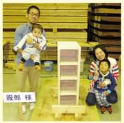
出来栄えに笑顔のご家族♡