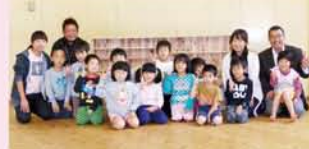
すみれ保育園の可愛い♡園児たちのところへお披露目会に行き参りました。