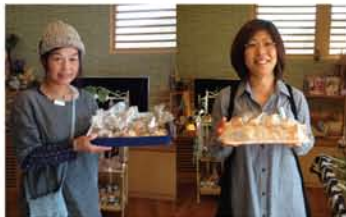
スタッフもパンやケーキを作って参加！大好評ですぐに完売となりました！