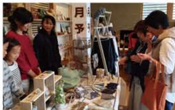
作家さんとお客さんがお話しする場面がこちらで見られ、とてもにぎわいました！

当日は布小物や洋服、アクセサリーやキャンドルなど、かわいい作品が店内を彩り、お越しくださった140名のお客様を笑顔にしてくれました。世界に一つだけの作品は、その一つ一つに人のぬくもりを感じられ、どれも本当に魅力的でした。そして何より作家さん一人一人がとてもイキイキとしていて、お客様とのコミュニケーションも本当に楽しそうでした。今回、初めての開催で不安もありましたが、沢山の方にお越しいただきました。嬉しいお声もいただきましたので、また来年2月に開催させていただきます。皆様のご参加お待ちしております！今回ご参加くださった皆様、どうもありがとうございました！