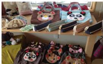
手づくりならではの温かみを感じられる作品がたくさん並びました！