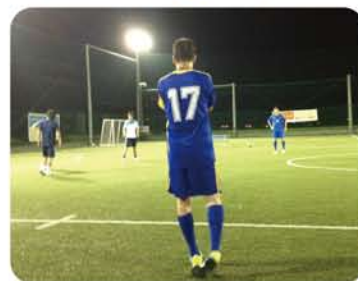
思い入れの背番号17