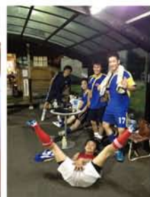
フットサルクラブ！ 愉快的仲間たち