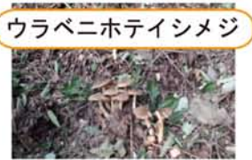
ウラベニホテイシメジ