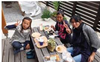
テラスでお食事の作家さんを発見！「外で食べるゴハンは美味ーい！」