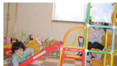
おうち たのしいよ