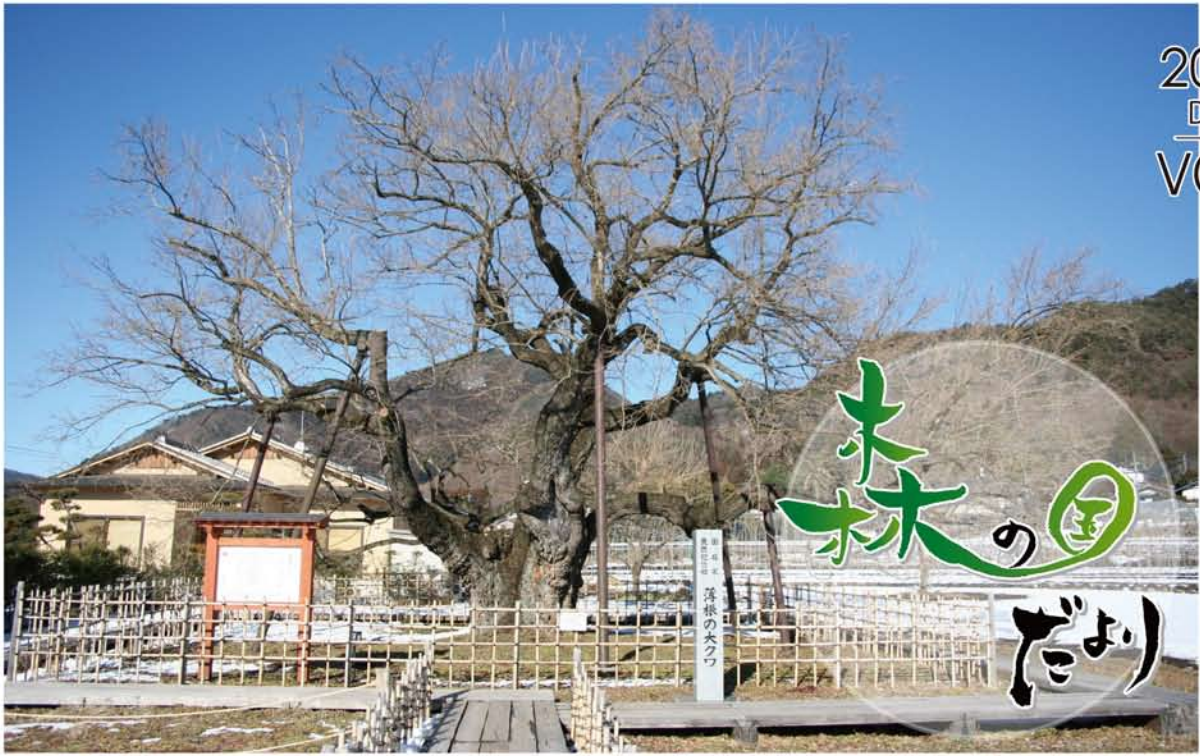
国指定 天然記念物「薄根のオオクワ」沼田市石墨町 第二工場徒歩5分