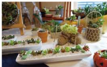
こちらでも人気だった多肉植物。鮮やかな緑が気持ちよやかにしてくれました。