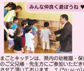
みんな仲良く遊ぼうね♡