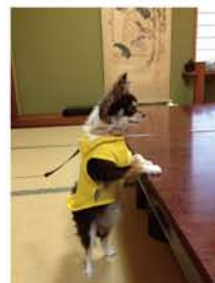
愛犬♥ さくらちゃん