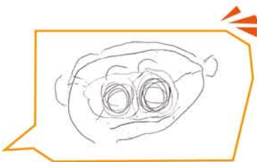
ゆいちゃん(3歳)が描いてくれた私