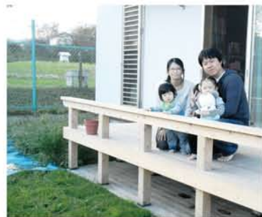
景色が最高のウッドデッキにて