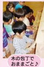
木の包丁でおまもごと♪