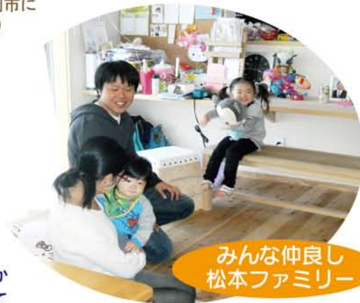
みんな仲良し 松本ファミリー