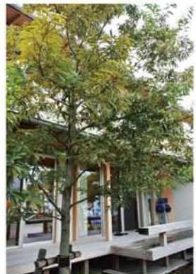
高崎展示場のコナラ