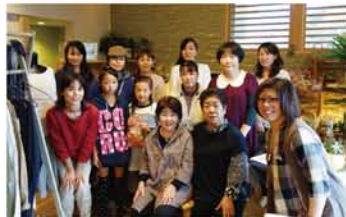
作家さんに集まってもらって記念撮影。次回開催時にまたお会いしましょう！

うれしいご感想をいただきました。 「お客様とたくさんお話もできて楽しく出店できました。次回開催に向けて作品づくりをがんばらなくちゃ♪」と作家さんの声。お客様からは「見ているだけで心温まる作品ばかりとても癒されました。スタッフさんのパンやケーキとても美味しかったです。」 皆様どうもありがとうございました。