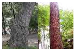
左がクロマツ、右がアカマツ、分かりやすいですね。