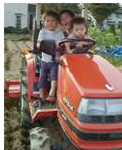
乗り物大好き～♪ 甥っ子さん3人組