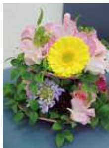
お花で気分を リフレッシュ♪

大人気の展示場や宿泊体験!!いつでも快 適にお客様がお過ごし頂けるようにこれか らも宜しく願ひします (・ω・)♪