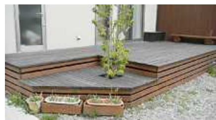
パパの力作 ウッドデッキ