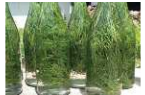
松の若葉と砂糖水で炭酸飲料「松葉サイダー」が作れるそうです。いつか作ってみたい・・・