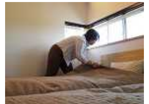
お客様がぐっすり眠れ ますように～♡