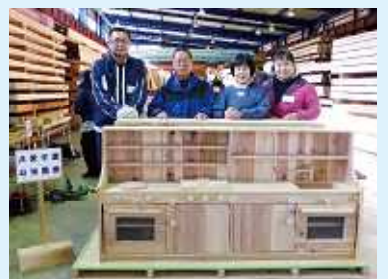
前橋市 共愛学園幼稚園 先生方