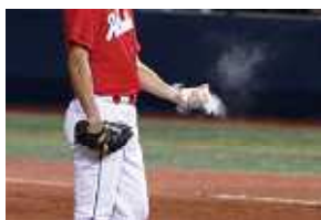
ピッチャーや体操選手が滑り止めに使う「ロジンバック」ロジンは松脂の主成分です。