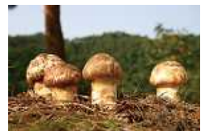
秋の味覚のマツタケが生えるのは良質なアカマツ林