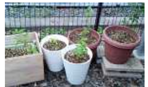
只今、木育て中 (こそだてちゅう)