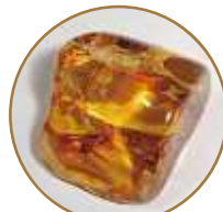
琥珀は松脂が地中で化石化したもの。土の中でも腐らないことがよく分かります。

◀籠城戦の際の薪や松明(たいまつ)、実や樹皮は食料としてお城に必ず運ばれました。