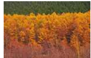
紅葉が見事なカラマツは日本の針葉樹で唯一の落葉樹。昔は電柱などにも使われていました。

また、わが群馬を含む19もの道県が、マツを県(道)の木としています。対してスギは5県、ヒノキは0県。北海道も沖縄県もマツですから植生の分布も広いことが伺えます。マツと言っても種類は多く、世界でマツ科に属するのは250種、日本でマツというとマツ族の中でもクロマツ、アカマツを指すことが多いようです。マツの仲間でも秋に黄色く紅葉し、冬に落葉するカラマツはカラマツ属と少し分類が異なります。マツの特徴はなんといってもその豊富な油脂「松脂」(マツヤニ)、主に昆虫などの寄生を妨げる目的で合成されるテルペンなどの揮発性物質で水に溶けない成分。燃料、粘着剤、生薬、香料、滑り止め、紙の添加剤など古くから使われてきました。松脂は地中でも腐らない成分を多く含むため木杭や杭木など土木用材としても用いられてきました。建築材としては粘り強く優れた強度から梁や桁などの横架材に好んで使われてきました。このように古くから身近に愛されてきた国産のマツですが、松くい虫や大気汚染による枯れ被害が急速に進み希少性が高まっています。