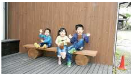
4代目たち☆20年後もお願いします♪