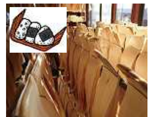
納豆やおにぎりを包む経木(きょうぎ)。うまみ成分や天然の殺菌効果を含み食品を包むには最適。中でも節が少なく、しなやかなアカマツが最高とか。

◀籠城戦の際の薪や松明(たいまつ)、実や樹皮は食料としてお城に必ず運ばれました。