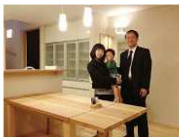
新居にて記念撮影～♪