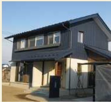
S様邸はネイビー色のカッコイイ外観