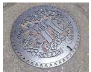
群馬県の木はクロマツ。わたしの地元キングオブ群馬の旧群馬郡群馬町のマンホールにもデザインされています。