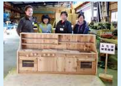
前橋市 ふたば保育園 先生方・ご父兄様