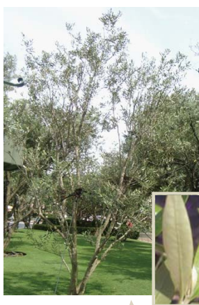
葉を楽しむなら オリーブ

光沢のある緑の葉を茂らせる。細長い葉の縁が波をうったようになるのも特徴。枝が細長く、成長しても繊細なイメージで人気です。