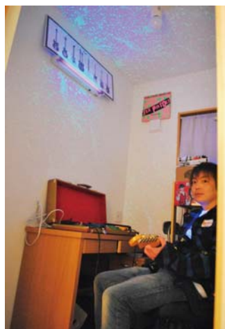
自慢の書斎でギターをギュー～ン♪ P7

ご主人様: いいでしょう。住んでからも楽しめるイベントを開催してくれて嬉しいですね！