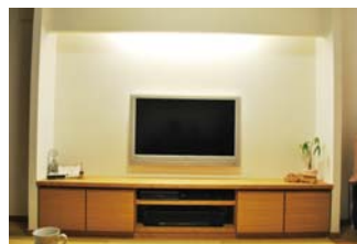
配線隠したTVボード