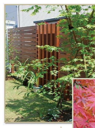
紅葉を楽しむなら ヤマモミジ

平和の象徴「オリーブの木」魅力はなんといってもその樹形です。細長い銀葉が庭のアクセントになります。