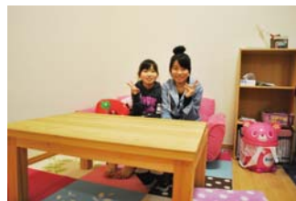
わたしたちもほしかった☆