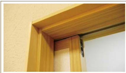
見える部分は細く美しく!!