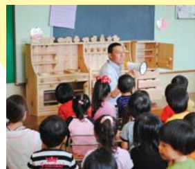
ちびっ子たちの思い出も刻めるミニキッチン