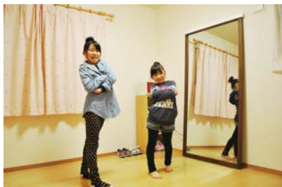
仲良しHIPHOP姉妹☆イエ～イ☆