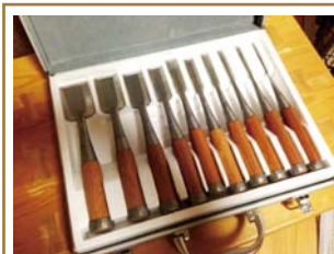
こちらが棟梁自慢のハイス鋼で作られたノミです♪