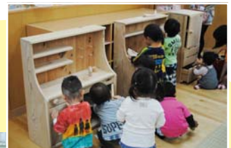
夢中で遊ぶ、ちびっ子たち