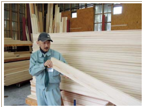
全ての木材に目を通し厳しくチェック!!