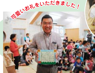
とびつき笑顔の社長