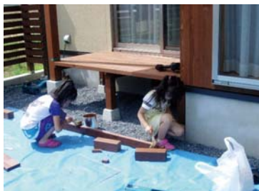
ウッドデッキもつくったよお！