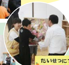
かわいい手作り感謝状