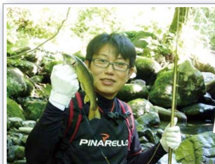
新鮮な岩魚が釣れました。

私の人生は、一般の方より波乱万丈？で、アクシデントが多く毎日乗り越えています。 人生一度きり悔いのないよう生きてゆきます！ カワイイお子様たち(3兄弟♪)のためにも、いつまでも元気に頑張ってください～い (´ω`o)♪