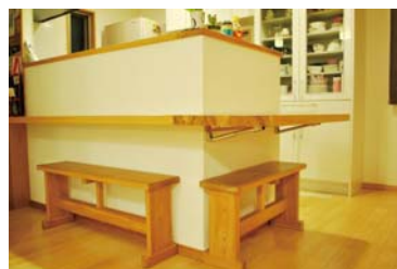
使い勝手バツガン！可動式カウンター