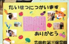
たいせつにつかいます ありがとう 吉岡町第三保育園