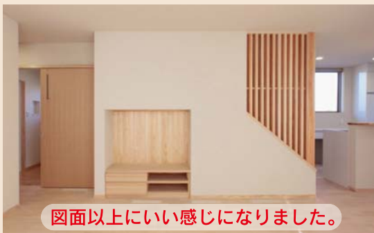
図面以上にいい感じになりました。