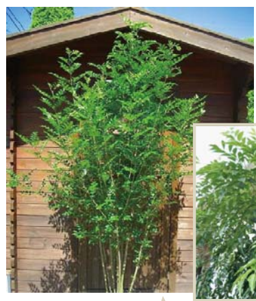
葉を楽しむなら シマトネリコ

家の象徴となるシンボルツリーは、植栽を考えるうえで重要な存在です。 「手入れが大変そう」と敬遠せずに比較的育てやすいものをご紹介しますので、チャレンジしましょう。 シンボルツリーには、枝ぶりのやわらかな雑木が好まれますが、葉の色や形、花を咲かせるもの、実をつけるものと樹種によって楽しみはさまざまです。育てやすい樹木の特徴を集めてみました。