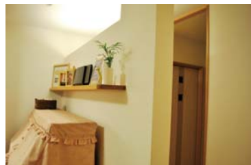
間接照明で雰囲気いいでしょ♪