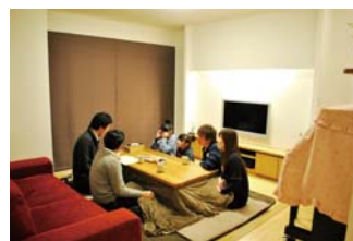
こたつでぬくぬく♪

本当にきれいな色ですね。新品の時もきれいでしたが、味がでてきたこの色もたまりませんね！！