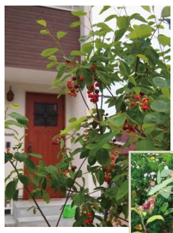
実を楽しむなら ジュンベリー

まっすぐに伸びる樹形で、丸みを帯びたハート形の葉をつける。明るい黄緑色が、ふんわりやわらかい雰囲気を出します。