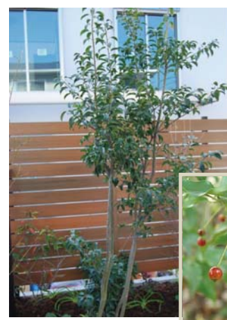
実を楽しむなら ソヨゴ

初夏に食べられる小さな赤い実をつける。やわらかな枝ぶりと、丈夫で手入れがしやすいことから、人気の高い樹木のひとつ。