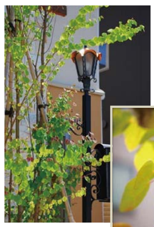
紅葉を楽しむなら カツラ

数あるモミジの中で最もポピュラーな品種で、和庭のシンボルツリーに良く用いられる。オレンジ色や赤色に紅葉します。