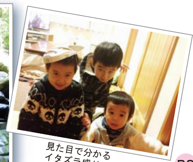
見た目で分かるイタズラ盛りの3兄弟